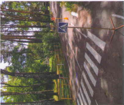
Вернуться на главную