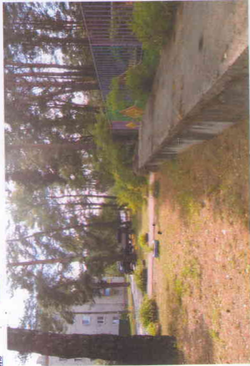
Подход к детскому саду со стороны ул. Бууровой